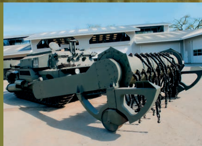
THE FASTEST FLAIL IN THE WEST 2