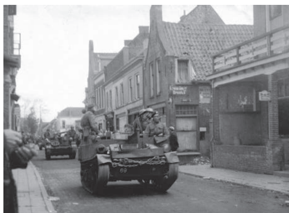
Universal Carriers in de straten van Doetinchem.

De podwalk en tv-serie maken deel uit van een heel jaar '80-jaar bevrijding' dat al in september is begonnen. Er zijn acht wandelroutes: Groesbeek ( Operatie Veritable ), Arnhem, Heteren, Opheusden, Wilp, Wageningen, Doetinchem en Zutphen. Het werkt als volgt. De podwalk-app vind je in de Appstore. Hij heet