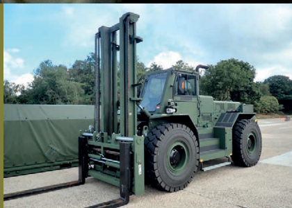
NIEUWE VORKHEFTRUCK VOOR DE KL