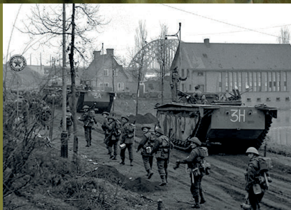
IN DE VOETSPOREN VAN DE BEVRIJDERS